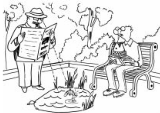
...картинка «магический глаз» может быть «прямой»... и «обратной»...

Конечно, эту программу нельзя назвать наилучшей из возможных (в Интернете сегодня можно отыскать немало аналогичных программ, более красиво оформленных, быстрее работающих, реализующих более высокое качество картинок). «За бортом» осталось построение многоцветных картинок с плавным изменением выпуклости и глубины одновременно и с