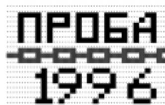
Рис. 2. «Шаблон» создаваемого объемного изображения

2 – «вторая градация выпуклости» для «звеньев цепочки» посередине рисунка.