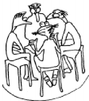
Занятия проводились в режиме факультатива (кружка)...

был повторен в разных регионах России. Далеко не во всех случаях автор сумел настоять на строгом соблюдении методики, и отклонения от нее сразу же приводили к заметному снижению эффективности занятий. Так произошло, например, в частной школе «Гуманитарий» в Пушкине, где попытались ограничиться только двумя языками. А в другой частной школе Санкт-Петербурга – «Дипломат» – источником проблем стала слишком высокая квалификация учителей: каждый демонстрировал целый арсенал собственных методических достижений, но в итоге это разрушило синхронность их работы.