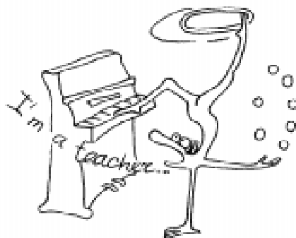
...каждый демонстрировал целый арсенал... методических достижений...

Пока же лишь можно сказать о том, что такой двухэтапный эксперимент был поставлен мною на собственном сыне. Сначала в ивановской «школе иностранных языков» он изучал 4 европейских языка. Затем вместе со старшеклассниками посещал мой математический кружок в 406 гимназии города Пушкина. В прошлом году он – ученик 3 класса – занял место среди лучших шестиклассников России по итогам обоих туров 4-ой Соросовской олимпиады по математике. В 5-ой Соросовской олимпиаде по математике, выступая по программе 7 класса, он – ученик 5 класса – набрал в первом туре 70 баллов из 70 возможных, во втором – 40 из 42, в третьем – 15 из 35 (а точнее – 15 из 21, так как две из пяти