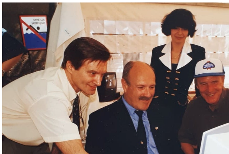
Рис. 3. Организатор (на рубеже 90-х годов)